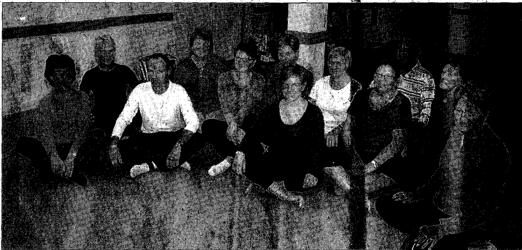
Le yoga ne requiert aucun esprit de compétition, ni avec soi-même, ni avec les autres.